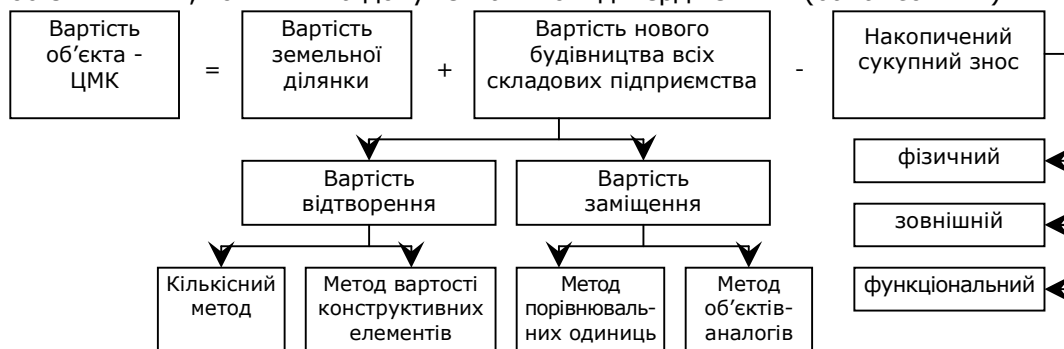
Рис. 2. Схема оцінки нерухомої частини ЦМК за витратним підходом

Витратний підхід, як свідчить його концептуальна основа, носить бухгалтерський характер, що робить всі розрахунки та вихідні дані об'єктивними, точними та документально підтвердженими (балансовими).