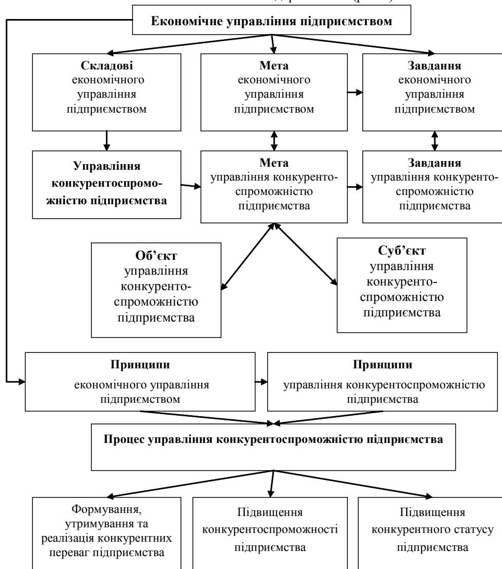
Рис. 1 Місце управління конкурентоспроможністю у системі економічного управління підприємством

У відповідності до базових положень науки управління та теорії конкурентоспроможності економічних систем, на засадах яких ґрунтується концепція управління конкурентоспроможністю підприємства, основними її елементами є мета і завдання, об'єкт і суб'єкт, методологія та принципи, процес та функції управління, які формуються та реалізуються у системі економічного управління підприємством (рис. 1).