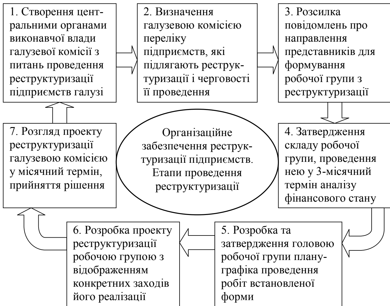
Рис. 1. Організаційне забезпечення реструктуризації підприємств