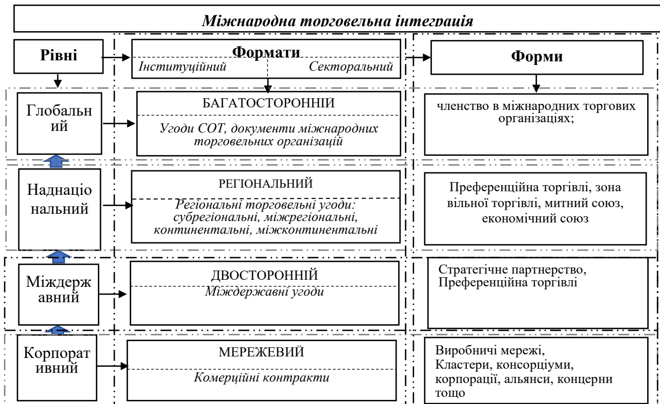
Рис. 1. Рівні формати та форми міжнародної торговельної інтеграції

розширення об'єкту регіональних торговельних угод (РТУ) до формату «СОТ+» (включають такі сфери, як митні правила, експортні податки, антидемпінг, компенсаційні заходи, технічні бар'єри в торгівлі або санітарні та фітосанітарні стандарти) та «СОТ-extra» (крім торговельної містять широкий набір політик – від інвестицій до екологічного законодавства або ядерної безпеки) – все це об'єктивно пришвидшує трансформацію форматів міжнародної торговельної інтеграції та вимагає перегляду підходів до розкриття її сучасної сутності, визначення рівнів, форматів та форм реалізації.