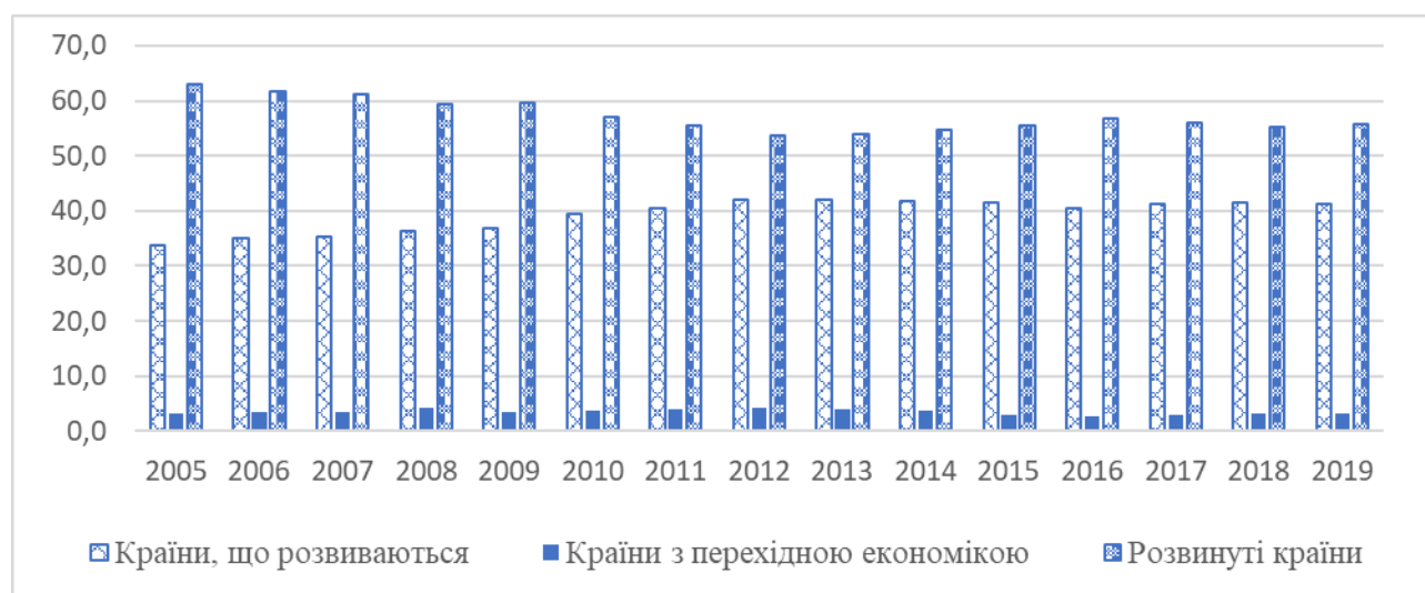
Рис. 3. Частка експорту країн що розвиваються, розвинутих країн та країн з перехідною економікою у світовому експорті 2005-2019 рр. (у %)

Включення у глобальну торгівлю доцільно визначити за допомогою розрахунку частки торгівлі країни (групи країн) або регіону у світовому обсязі експорту або імпорту (рис. 3).