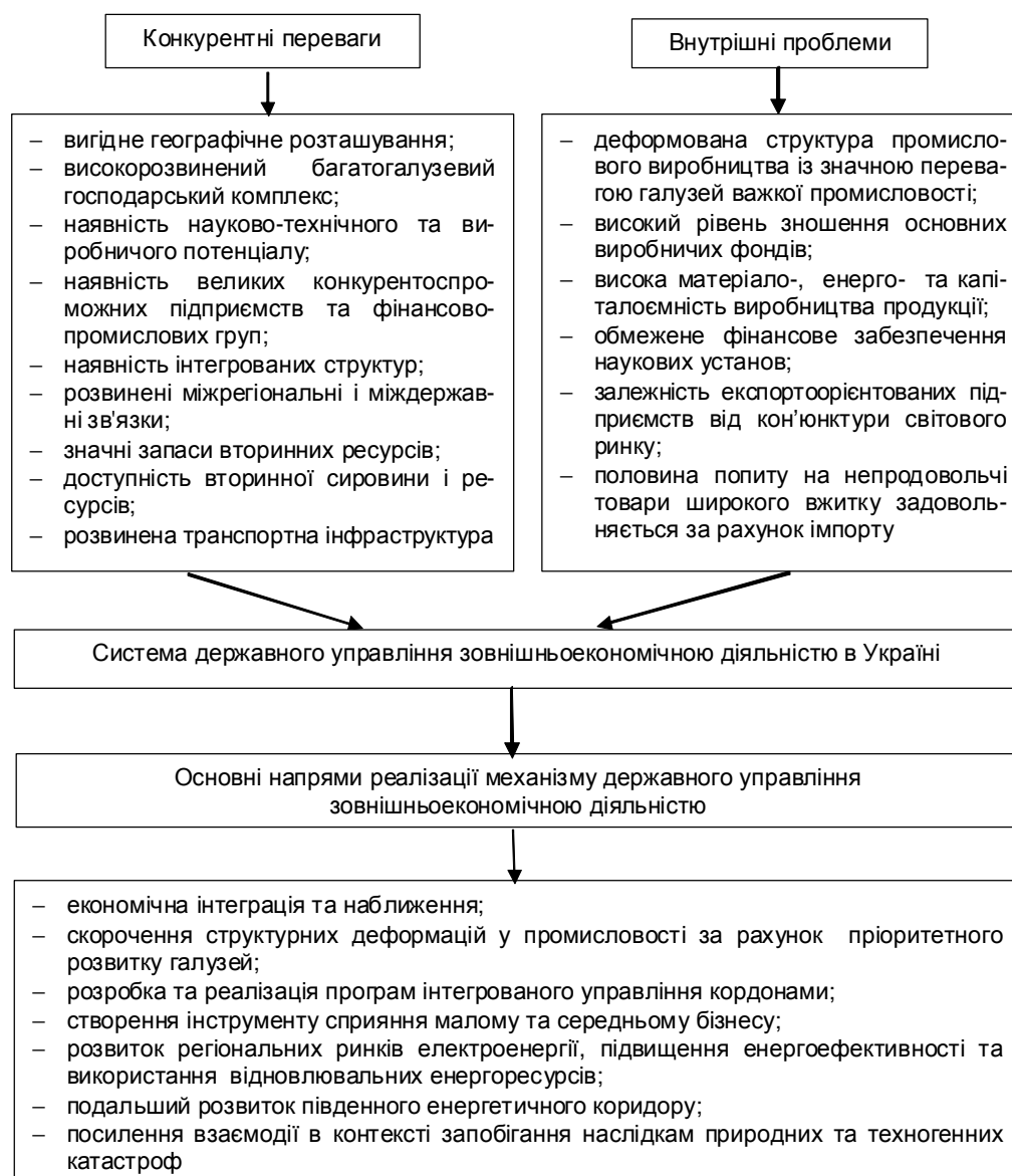
Рис. 2. Схема системи державного управління зовнішньоекономічною діяльністю в Україні

залучення економіки України в систему світового поділу праці та її наближення до ринкових структур розвинутих зарубіжних країн, що враховують вплив сучасних міжнародних інтеграційних процесів.