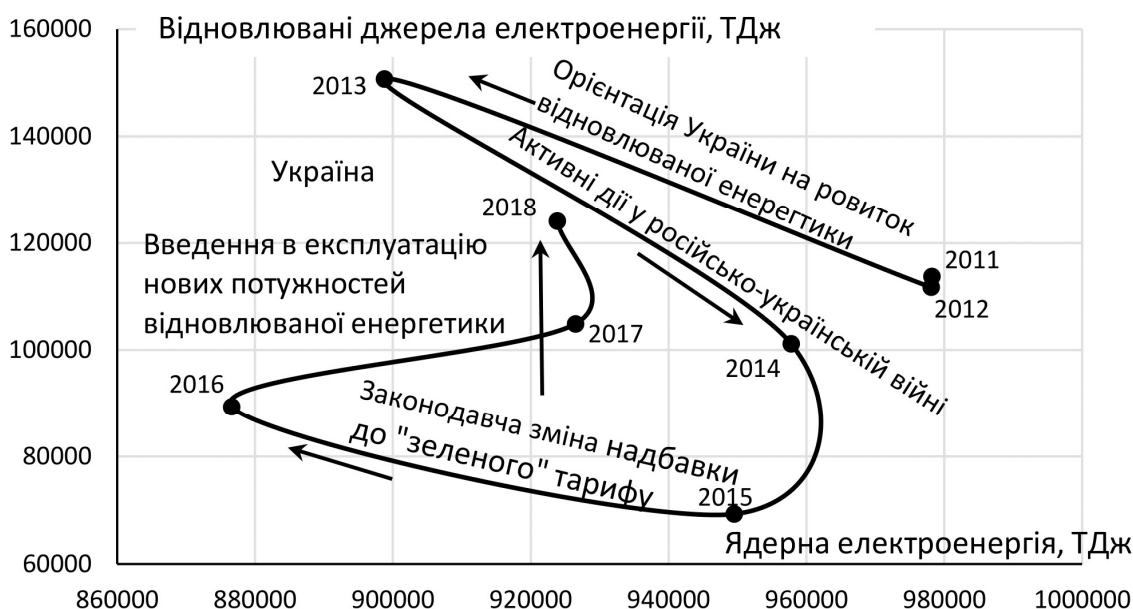
Рис. 3. Фазова діаграма співвідношення у виробництві ядерної енергії та відновлюваних джерел енергії за період 2011–2018 рр. в Україні

спостерігається на фазовій діаграмі (рис. 3). Кожна із фаз залежить від низки факторів, які різною мірою можуть впливати на перебіг процесів у цих сферах енергетики. На рисунку представлено найбільш значущі події для кожної з фаз, які умовно представлені як зміни за один рік.