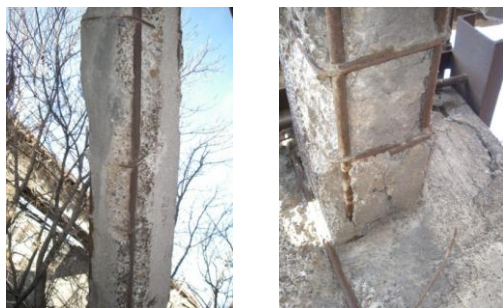
Рис. 1. Фото пошкоджень опор шляхопроводу в місті Одеса

впів) з відшаруванням частини бетону та оголенням стиснутої арматури.