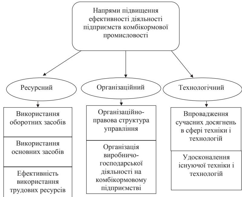
Рис. 2. Напрями пошуку підвищення економічної ефективності виробничо-господарської діяльності підприємств комбікормової промисловості

Висновки і пропозиції. Отже, економічна ефективність виробничо-господарської діяльності на макrorівні залежить від якості проведення комплексної оцінки кінцевих результатів використання основних і оборотних фондів, трудових і фінансових ресурсів, а також нематеріальних активів за визначений період часу. Але проведення комплексної оцінки економічної ефективності не є достатньою для прийняття управлінських рішень, оскільки вона не охоплює всіх складових виробничого проце-