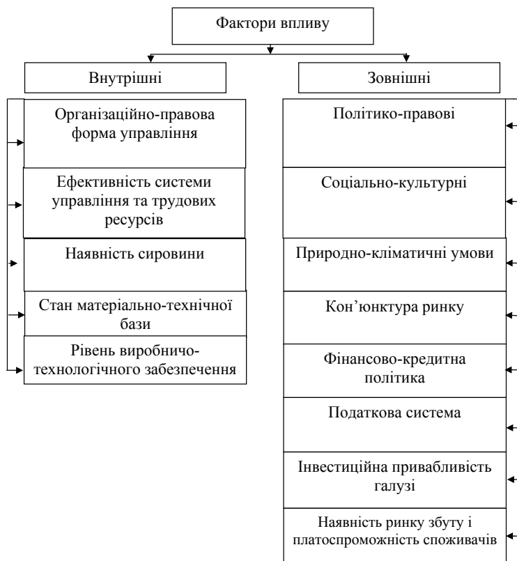
Рис. 1. Фактори, що визначають економічну ефективність господарської діяльності підприємств

Особливу увагу проблемі дослідження теоретичних і методологічних основ ефективності розвитку підприємств приділено в наукових працях В. Андрійчук, П. Борщевського, В. Волинця,