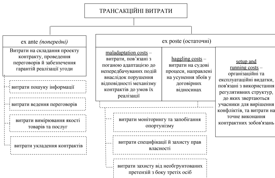
Рис. 1. Види трансакційних витрат за О. Уільямсоном

Базовими умовами розвитку сучасного українського будівельного сектора економіки в умовах ринкової реструктуризації і все активнішої глобалізації є реалізація інвестиційно-фінансового потенціалу та ефективне інституціональне забезпечення його функціонування. Інституціональне середовище будівельного сектору представимо у вигляді чотирьох блоків (рис. 2): 1) формальні