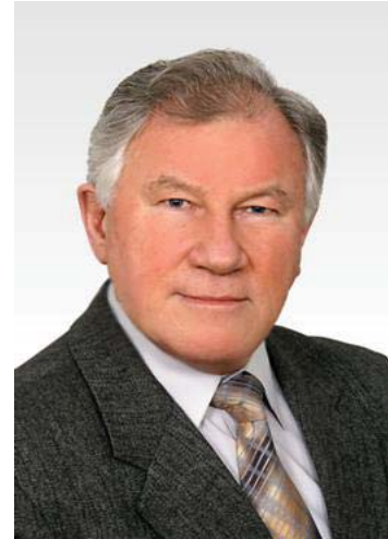
Професор В. В. Сафонов (1978–1983)

У цей період зусилля колективу кафедри були спрямовані, в основному, окрім навчального процесу, на створення матеріальної і навчально-методичної бази, оскільки кафедра створювалася практично з нуля.