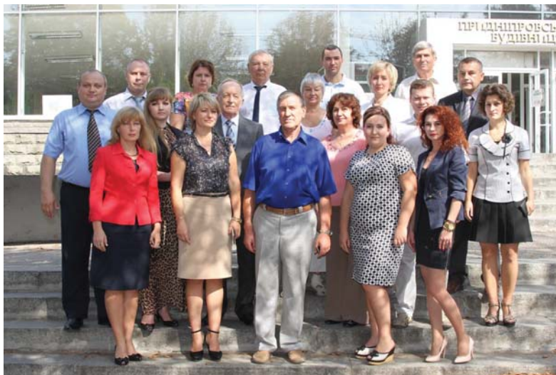
Склад кафедри безпеки життєдіяльності (2019)

На кафедрі «Безпека життєдіяльності» відкрито аспірантуру і докторантуру зі спеціальності «Охорона праці». Працює спеціалізована вчена рада із захисту докторських дисертацій із цієї спеціальності.