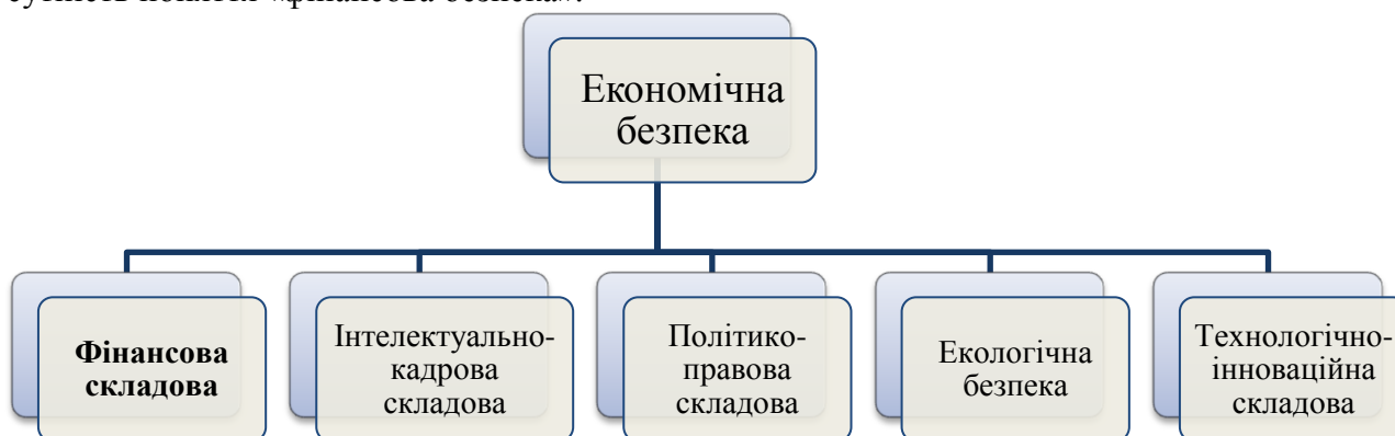
Рис. 1. Складові економічної безпеки підприємства

підприємства. Для досягнення фінансової безпеки на підприємстві необхідно розробити механізм забезпечення фінансової безпеки. Для розгляду цього механізму визначимо сутність поняття «фінансова безпека».