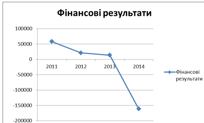
Рис. 2. Динаміка фінансових результатів промислових підприємств за 2011-2014 рр.

Найбільш прибутковою галуззю є переробна промисловість, практично 65% всієї кількості підприємств переробної промисловості. А в розрізі підприємств переробної промисловості – виробництво основних фармацевтичних продуктів і фармацевтичних препаратів – 72,7% прибуткових підприємств, найменш прибутковою – добувна промисловість, яка має лише 46,5%.