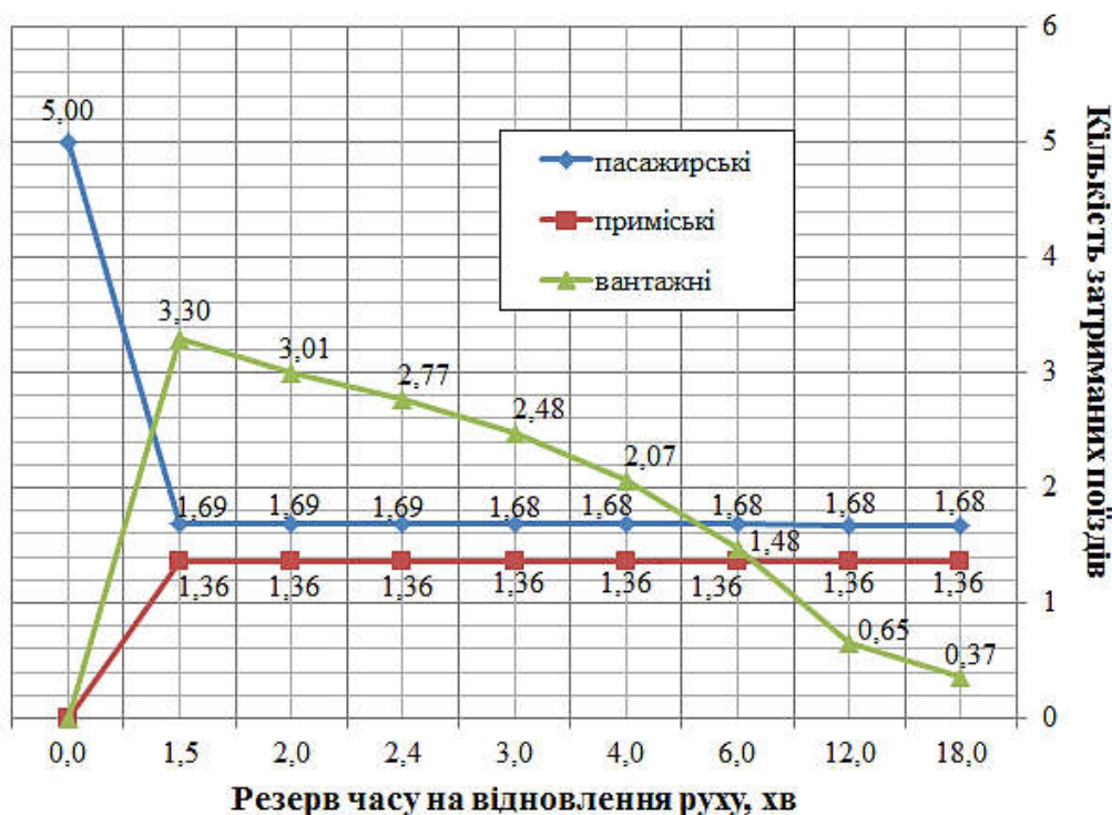
Рис. 3. Залежність кількості затриманих поїздів різних категорій від зміни величини резерву часу на відновлення руху вантажних поїздів

Висновки. Запропонована процедура на основі епідеміологічної SIR-моделі дає змогу визначити експериментальним шляхом найбільш раціональні резерви часу на відновлення руху поїздів різних категорій залежно від кількості затриманих пасажирських поїздів. Встановлено, що для ділянки Л–С раціональним резервом часу на відновлення в нитці графіка руху для пасажирських поїздів є 4 хв, для приміських – 6 хв, для вантажних – 12 хв. Проведене дослідження дозволило теоретично