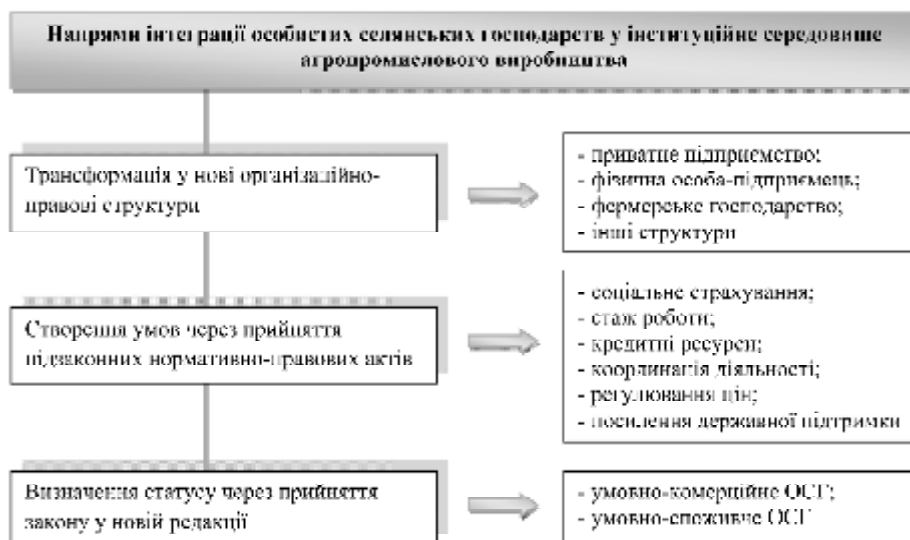
Рис. 2. Напрями інтеграції особистих селянських господарств у інституційне середовище агропромислового виробництва

Процес вдосконалення механізму реалізації прав власників особистих селянських господарств через прийняття системи підзаконних нормативно-правових актів повинен охопити питання соціального та пенсійного страхування, стабілізації цін на сільськогосподарську продукцію, забезпечення вільного доступу до кредитних ресурсів, надання особистим селянським господарствам техніки на умовах