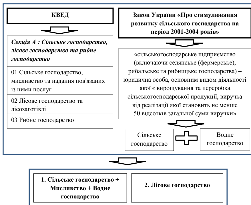
Рис. 1. Законодавча колізія щодо групування сільськогосподарських, мисливських, рибних та лісових господарств