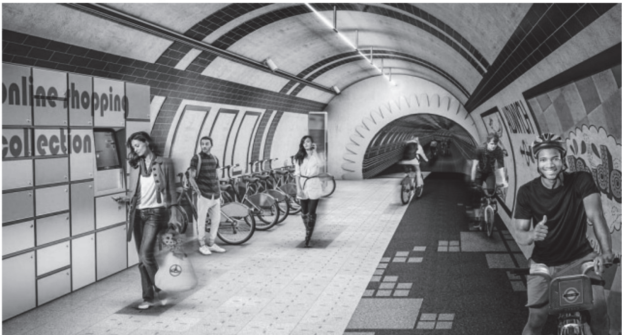
Рис. 2 - Впровадження інноваційних технологій у формування просторів велокомунікацій США та Великої Британії

У подальших дослідженнях варто приділити увагу дослідженню даного сегменту у вітчизняній практиці. Розглянути відношення вітчизняної архітектурно-дизайнерської спільноти до сучасних напрямів формування простору вздовж велосипедних комунікацій.