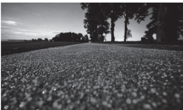
в - Люмінесцентна велодоріжка (м. Лізбарк-Вармінський, Польща, за матеріалами [4])