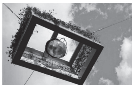
б - Озеленення над комунікаціями “Green Lights” вночі і вдень (м. Ейндховен, Нідерланди, за матеріалами [7])