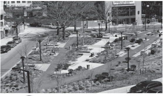
а - Queens Plaza Bicycle (м. Лонг-Айленд-Сіті, США; за матеріалами [5])