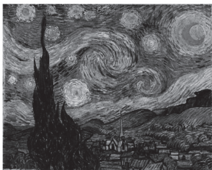
а - Траса для велосипедистів “Van Gogh-Roosergaarde” (м. Ейндховен, Нідерланди; за матеріалами [37])