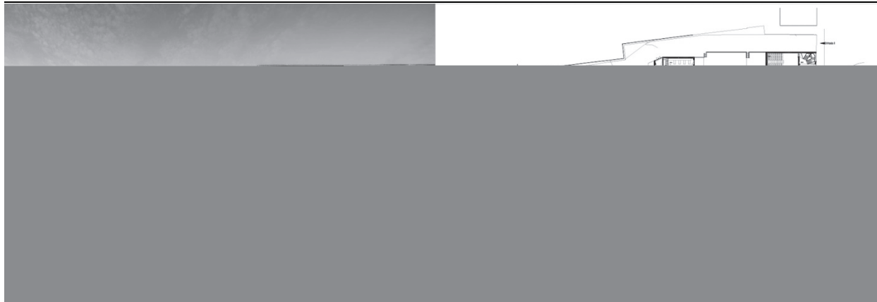
Рис. 1. Проект школи « Santa Maria High School » у Португалії, арх. Appleton Domingos Arquitectos