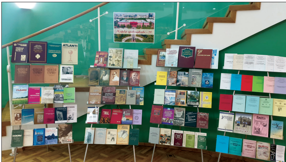
Виставка праць, присвячена 75-річчю кафедри архівознавства та спеціальних галузей історичної науки. Листопад 2019 р.

За три чверті століття професори та викладачі кафедри підготували понад 900 спеціалістів для архівної галузі, прочитали близько 250 різнопланових нормативних та спеціальних курсів, опублікували 86 підручників та навчально-методичних посібників, 92 монографічні видання, понад 1200 статей у журналах і збірках наукових праць та взяли участь у близько 1000 наукових конференцій, сесій, читань, круглих столів. Про основні напрями наукової та навчально-методичної роботи колективу кафедри у галузі архівознавства, джерелознавства, історіографії, спеціальних історичних дисциплін можна отримати докладнішу інформацію завдяки бібліографічному покажчику, підготовленому до 75-річчя діяльності кафедри 8 .