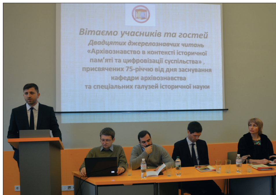
Голова Державної архівної служби України А. Хромов виступає з доповіддю на XX Джерелознавчих читаннях. 28 листопада 2019 р.