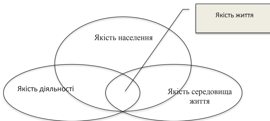
Рис. 1. Структура якості життя [7]

Економічна теорія щастя використовує ординалістський (порядковий) підхід, який базується на моделі упорядкування суб'єктивних оцінок, розробленої у 1975 р. Р. Маккелві та У. Завоїна. Відповідно до моделі індивіди повинні вказати на шкалі порядковий номер свого рівня щастя. Об'єктивність досліджень на базі такої моделі