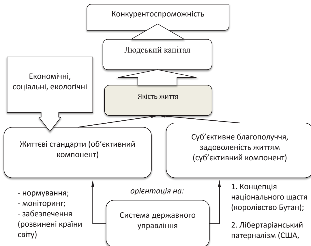
Рис. 3. Якість життя: базові компоненти