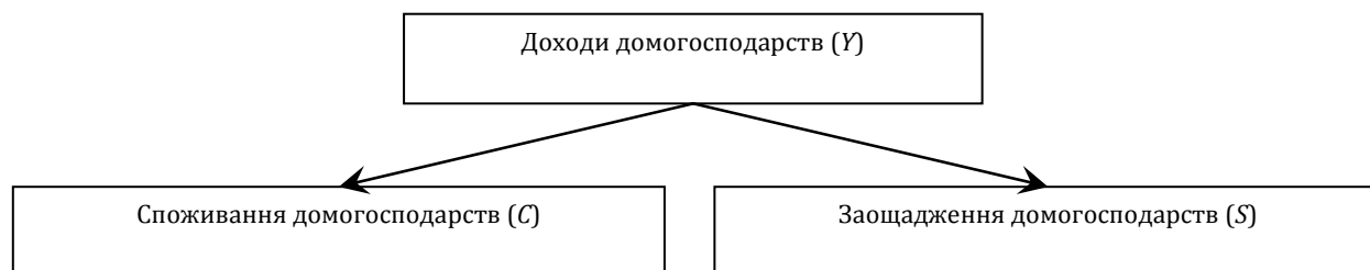
Рис. 1. Схематичне зображення структури доходів домогосподарств

При кількісній оцінці кінцевого ефекту від реалізації проектів, пов'язаних із використанням національних ресурсів, ми пропонуємо звернутися до аналізу рівня зростання реального добробуту осіб, що підпадають під дію таких державних заходів. Розглянемо структуру доходів домогосподарств детальніше. Схематично доходи домогосподарств в економічній теорії поділяються на споживання та заощадження (рис. 1).