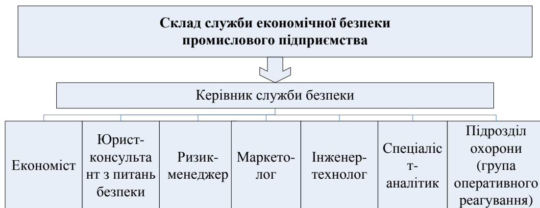
Рис. 3. Склад служби економічної безпеки промислового підприємства*

створення таких служб не є поширеним явищем, що є однією з ключових проблем управління економічною безпекою та зумовлює її низький рівень.