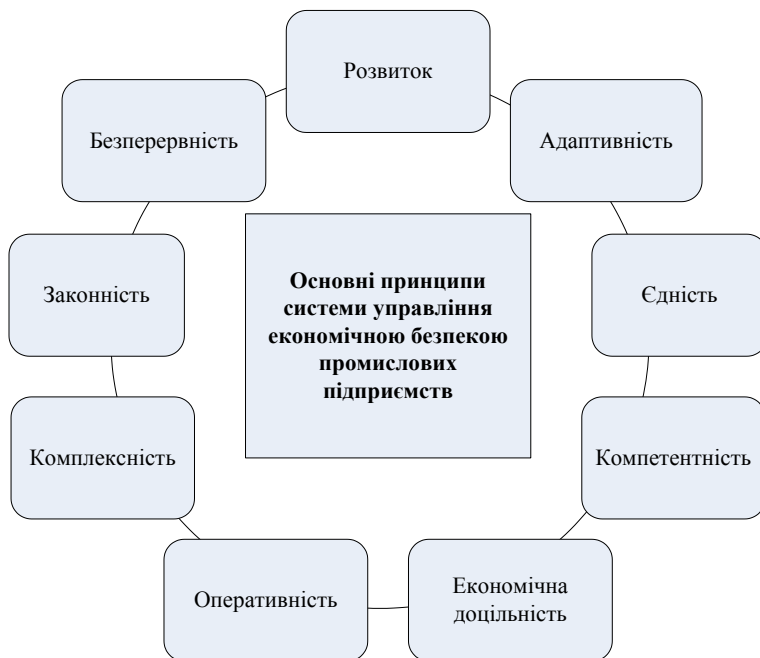
Рис. 1. Принципи системи управління економічною безпекою промислових підприємств*

Суб'єкти системи управління економічною безпекою можна поділити на внутрішні (працівники підприємства) та зовнішні (держава та її інститути, банки, конкуренти, посередники, споживачі, постачальники).