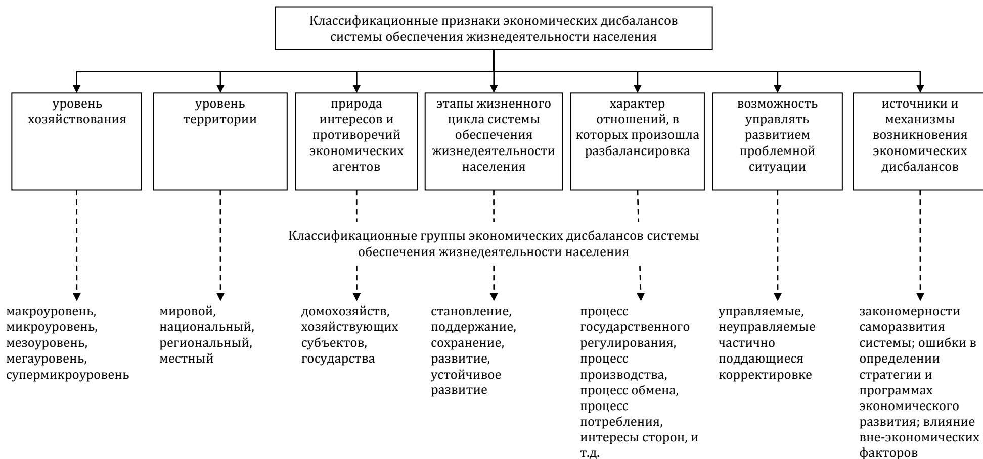
Рис. 2. Принципы классификации экономических дисбалансов системы ОЖН, влияющих на национальную безопасность страны (авторская разработка)