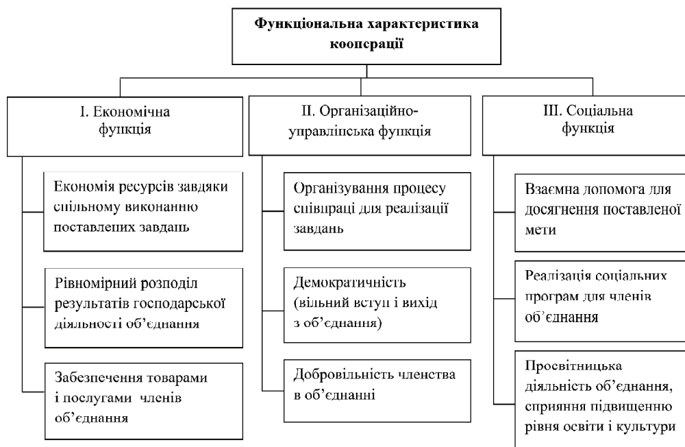
Рис. 2. Функціональна характеристика кооперації

Згідно з наступним запропонованим підходом, кооперацію у вузькому розумінні слід розглядати як особ-