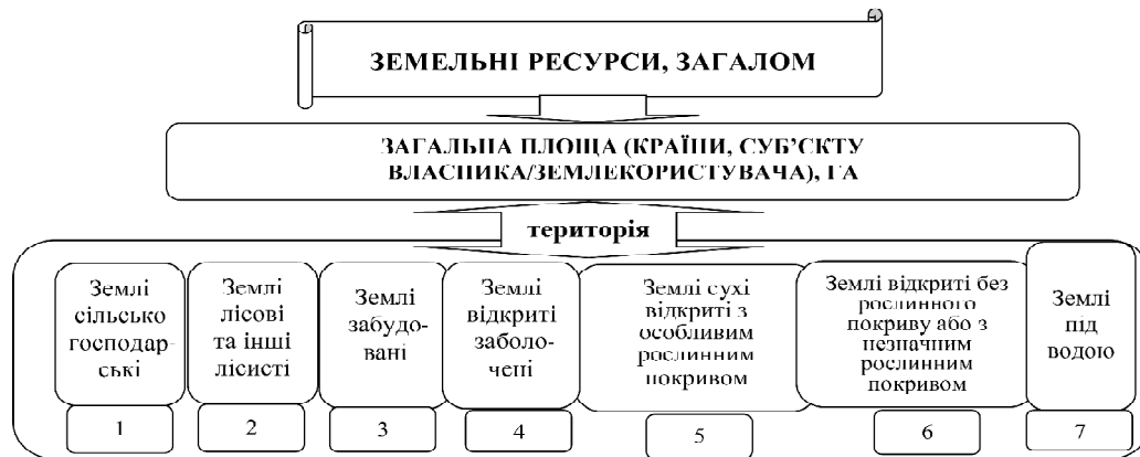
Рис. 1. Схема поділу земельних ресурсів за категоріями ССКЗ ЄЕК/ФАО ООН (1989 р.)