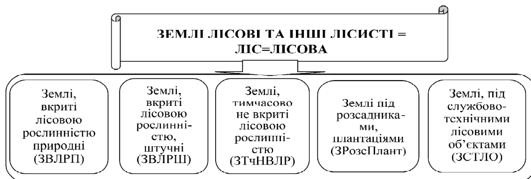
Рис. 2. Розподіл категорії "землі лісові=ліс" за екологічними компонентами лісових екосистем

Матеріал буде цінним і на майбутнє, наприклад, на 2050 рік чи на початок ХХІІ ст. (табл. 6) для певних досліджень і оцінки стану лісів у державному лісівництві. При цьому актуалізацію наведених показників проведемо з їх адаптацією до європейського законодавства і, крім того, за пропонованими нами компонентами лісових екосистем та переформованими показниками таблиці 5 до форми таблиці 6. Тобто з виокремленням власне лісів у межах категорії землекористування "Землі лісові" (ЗЛ = Ліс = Лісова екосистема, рис. 3) та "Землі інших облікових категорій землекористування" у складі ЗЛГП за їх фізичним змістом, рисунок 4 (графи 8—10).