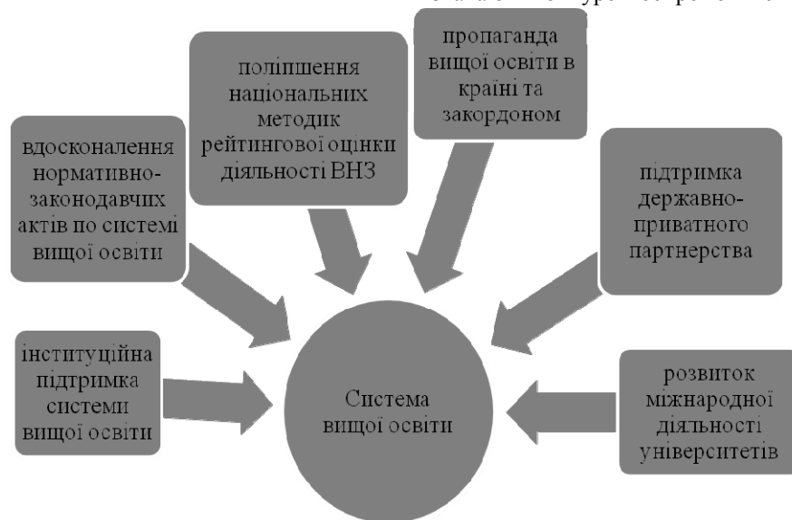
Рис. 1. Фактори підвищення конкурентоспроможності національної системи вищої освіти

Оскільки ВНЗ є однією зі складових системи вищої освіти, розглянемо основні фактори, що визначають конкурентоспроможність ВНЗ (рис.2).