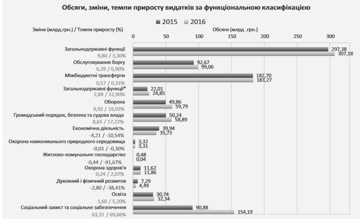
Рис. 1. Планові видатки Державного бюджету України за 2015-2016 рр. [8]