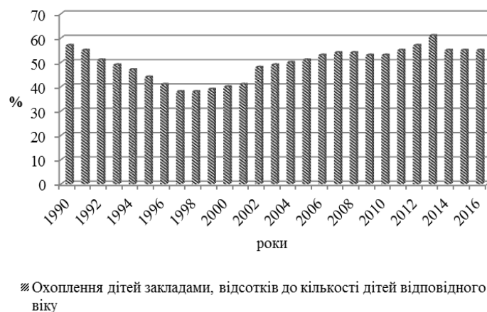
Рис. 4 Охоплення дітей закладами у відсотках до кількості дітей відповідного віку [побудовано на основі джерела [4]]

Аналіз даних рис. 4 дає змогу зробити висновок, що в Україні понад 50 % дітей дошкільного віку забезпечені місцем у дошкільних закладах. Причинами охоплення не всього контингенту дітей дошкільного віку дитячими закладами, в першу чергу, є не повністю врегульована ситуація з вільними місцями у дитячих садочках, а також бажання батьків самостійно виховувати та розвивати дитину без відвідування дошкільного закладу.