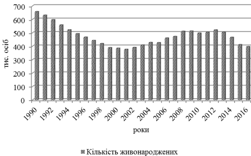
Рис. 2 Кількість живонароджених у 1990 – 2016 рр. [побудовано на основі джерела [4]]

Дані рис. 2 свідчать про тенденцію до зменшення кількості живонароджених у 1990-2002 рр., а з 2003 р. спостерігається позитивна динаміка народжуваності.