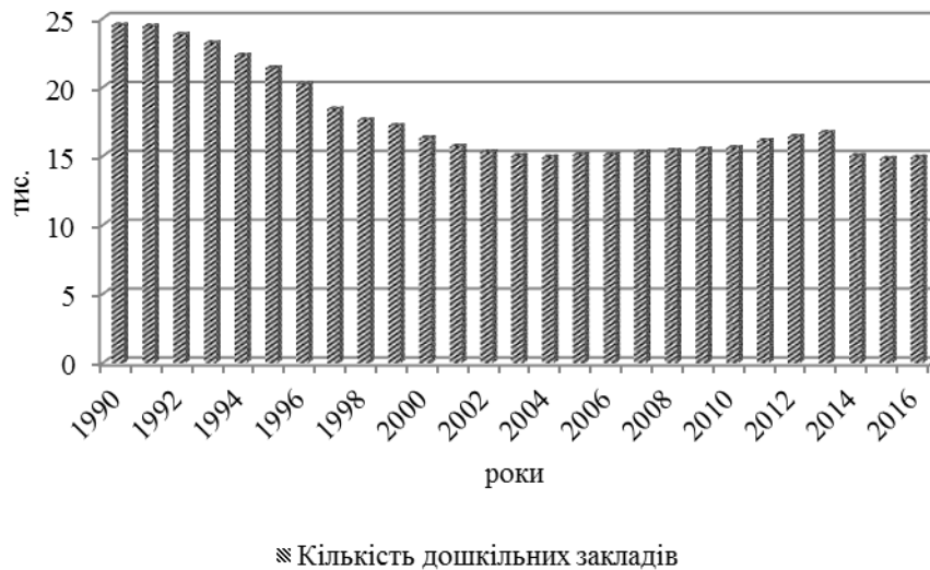
Рис. 1 Кількість дошкільних навчальних закладів за 1990-2016 рр. [побудовано на основі джерела [4]]

Отже, виходячи з даних рис. 1 можна спостерігати тенденцію до зниження кількості дошкільних закладів у 1990-2004 рр. Даний процес обумовлений впливом об'єктивних факторів: становлення незалежної держави, складна економічна та соціальна ситуація, і як наслідок зниження народжуваності (рис. 2).