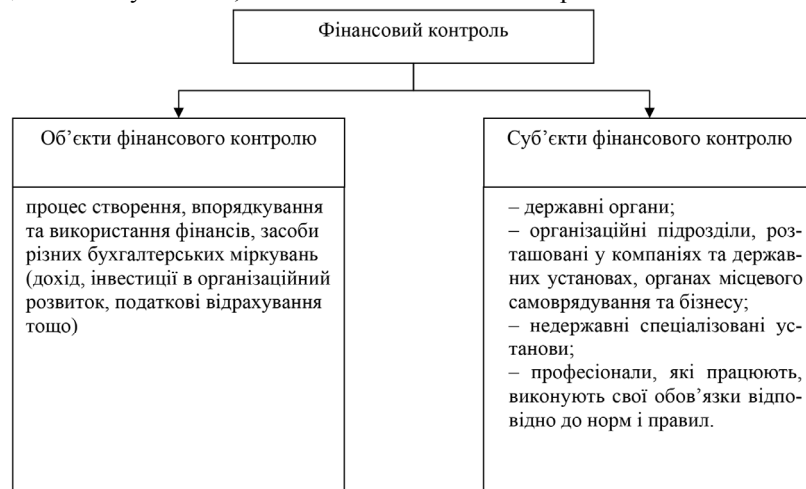
Рис. 1. Об'єкти та суб'єкти фінансового контролю

Об'єкти та суб'єкти фінансового контролю предсталено на рис. 1.