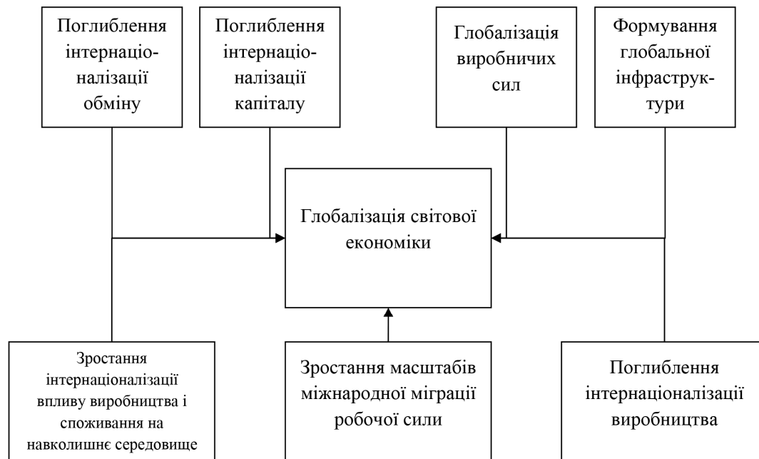
Рис. 1. Структура глобалізації економіки

Глобалізація та згуртованість зачіпають: