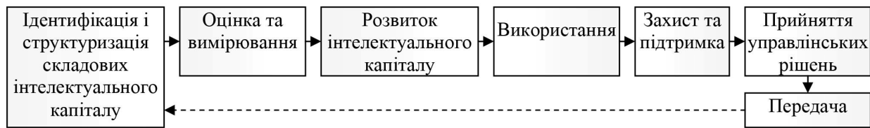
Рис. 3. Елементи системи стратегічного управління інтелектуальним капіталом банку

Отже, елементи системи стратегічного управління інтелектуальним капіталом банку можуть мати наступний вигляд (рис. 3).