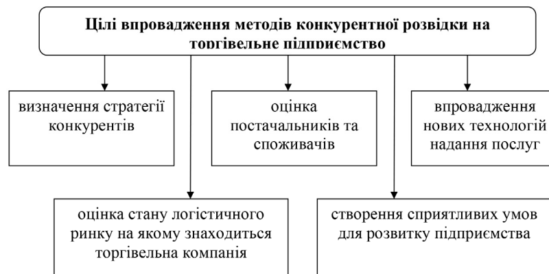
Рис. 1. Цілі впровадження методів конкурентної розвідки на торговельне підприємство