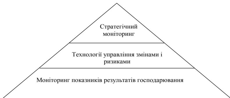
Рис. 2. Ієрархічність визначення моніторингу ефективності розвитку ринкових взаємодій [4]

Слід відзначити, що за переконанням авторів, аналогічно до бар'єрів між зовнішнім і внутрішнім середовищами бізнесу, про які вже йшлося вище, кордони між стратегією тактикою розвитку — є достатньо умовними, рівень і прозорість яких змінюється з часом і залежно до обставин.