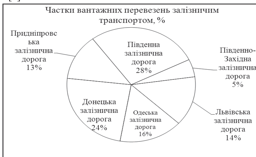
Рис. 1. Частки вантажних перевезень залізничним транспортом [4]

На рисунку 1 наведено частки вантажних перевезень на залізничному транспорті [4].