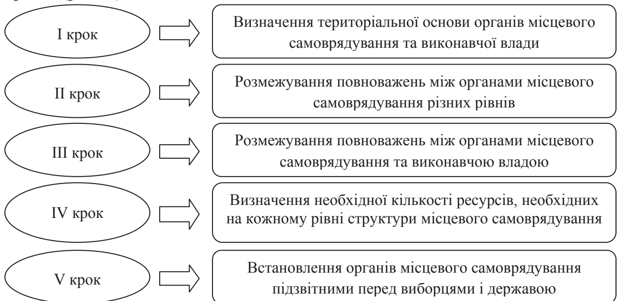
Рис.1. П'ять кроків проведення децентралізації влади

Проведення цієї політики передбачається зробити у п'ять кроків (рис. 1).