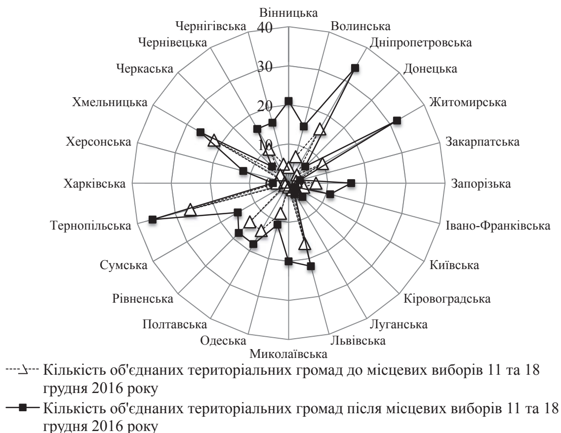
Рис.2. Порівняння кількості створених об'єднаних територіальних громад по областям України Побудовано авторами

Аналізуючи стан бюджету до проведення децентралізації та після, можна сказати, що за результатами таблиці 2 приріст надходжень до загального фонду у 2015 році проти 2013 року склав 1103,3 млн. грн., тобто 47,9 %, що на 948 млн. грн., або 85,9 % більше приросту доходів 2014 року проти 2013 року. Серед доходів загального фонду найбільшу питому вагу на кінець 2015 року мали офіційні трансферти, що склали 92,8 % від усіх доходів цього фонду.