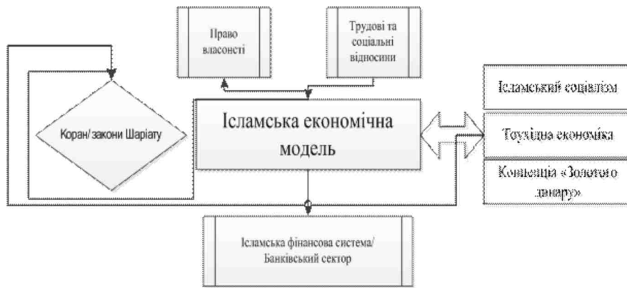
Рис. 1. Система складових ісламської економіки

Перш за все, спираючись на Коран, сутність «ісламської економіки» полягає у відмові від відсотка, від ф'ючерських угод, від «повітряної економіки» (рис. 1). Найбільш спорідненою в цьому плані є методика роботи в проектному інвестуванні, що практикується в європейській економіці. Але це проектне інвестування, яке пов'язане з розділом ризиків, з пайовою участю, тобто сам банк ніяких відсотків не отримує. Банк вивчає у свого клієнта бізнес-план, який той йому надав, аналізує ризики, і, якщо він це приймає, то потім відбувається розділ прибутків. Це найбільш універсальна форма, хоча є й такі, які стосуються торговельних проектів. Наприклад, існує ісламське страхування і т. д.