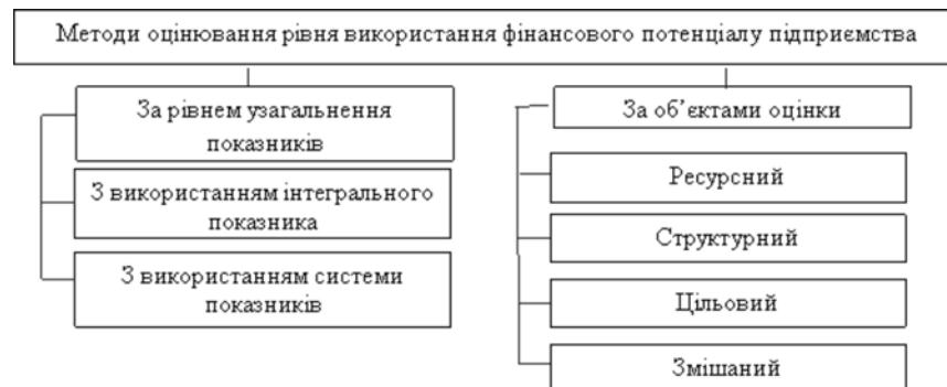
Рис. 2. Методи оцінювання рівня використання фінансового потенціалу підприємства складено за даними: [6, с. 90-92]

Наступним етапом в управлінні фінансовим потенціалом підприємства має бути доцільно визначення методів, за якими можна зробити висновок щодо якості управління ними. В основу методів оцінювання рівня використання фінансового потенціалу підприємства закладено аналізування результатів його діяльності за окремими напрямками, з врахуванням впливу факторів та виявлення резервів підвищення ефективності використання фінансових ресурсів (див.рис. 2).