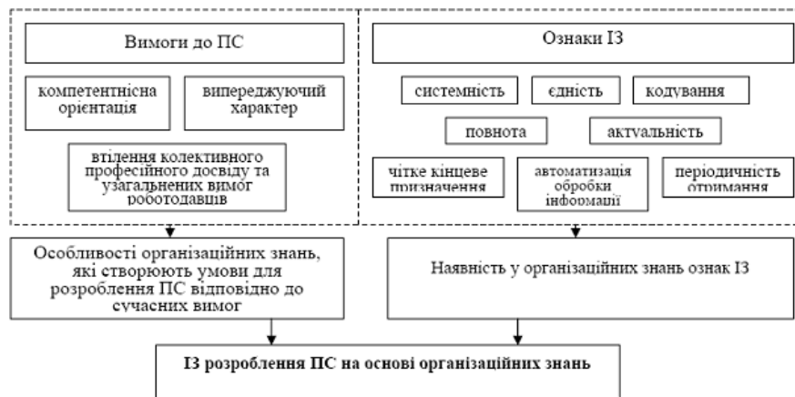
Рис. 1. Теоретичне підґрунтя ІЗ розроблення ПС на основі організаційних знань

Для втілення наведеного підходу у практику необхідно мати можливість визначити, по-перше, в якій мірі у організаційних знань суб'єктів господарювання проявляються ознаки ІЗ, і, по-друге, в якій мірі наявні організаційні знання створюють умови для розроблення ПС відповідно до сучасних вимог.