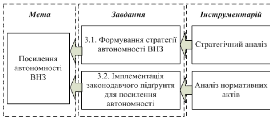
Рис. 6. Взаємозв'язок мети, завдань та інструментарію третього етапу

Етап 3. Посилення автономності ВНЗ. Головною метою даного етапу є визначення шляхів щодо посилення автономності ВНЗ. Основними з яких пропонується розглядати формування стратегії автономності ВНЗ (завдання 3.1) та імплементація законодавчого підґрунтя посилення автономності (завдання 3.2)