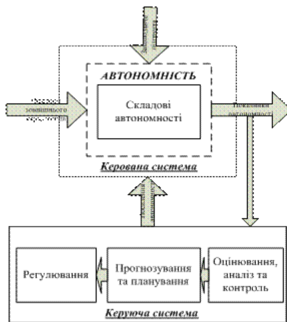
Рис. 2. Представлення автономності з позиції системного підходу

Розглядання автономності з позицій системного підходу дозволяє процес її управління представити наступним чином (рис. 2).