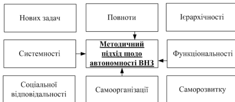
Рис. 1. Принципи методичного підходу щодо посилення автономії ВНЗ

Методичний підхід базується на системі принципів (рис. 1).