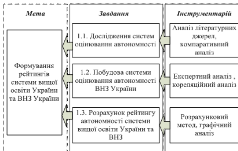
Рис. 4. Взаємозв'язок мети, завдань та інструментарію першого етапу

Реалізація завдання 1.1 передбачає визначення існуючих систем оцінювання автономності ВНЗ на базі дослідження світового досвіду. Проведення компаративного аналізу дозволяє визначити слабкі та сильні сторони існуючих систем оцінювання, що формує передумови розробки ефективної національної системи оцінювання автономності ВНЗ.