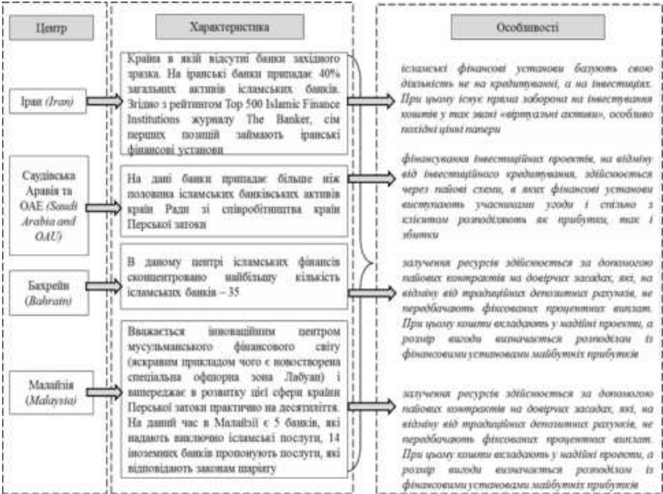
Рисунок 1. Особливості ведення фінансової діяльності центрів ісламських банків та їх характеристика (складено автором на основі [2, 6, 7])

Згідно із принципами ісламського банкінгу заборонено нарахування позичкового відсотка й фінансування заборонених видів діяльності (наприклад, торгівля алкоголем, свининою, ігровий бізнес). Поряд із цим ісламський банкінг також вимагає від фінансових інститутів особистої участі у ризиках фінансованого проекту, що має на увазі розподіл прибутку й збитків по проекту з позичальником коштів. Ці вимоги стимулюють ісламський бізнес приділяти належну увагу аналізу ризиків, пов'язаних з передбачуваним проектом, і моніторингу над витратами.