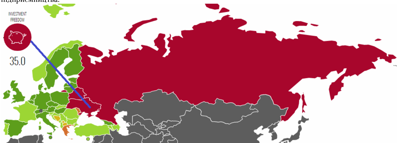
Рис. 3. Рівень незалежності інвестування в Україні серед інших країн Європи у 2020 році: інфографіка

Для оцінки привабливості інвестування України слід зупинитися ще на аналізі індексу інвестиційної незалежності (рис. 3), який станом на 2020 рік становить 35. Використовуючи ту саму шкалу, що й для визначення рівня економічної свободи отримуємо, що Україна відноситься до групи із залежним інвестуванням, потребує притоку інвестицій для забезпечення розвитку галузей та інноваційного підприємництва.