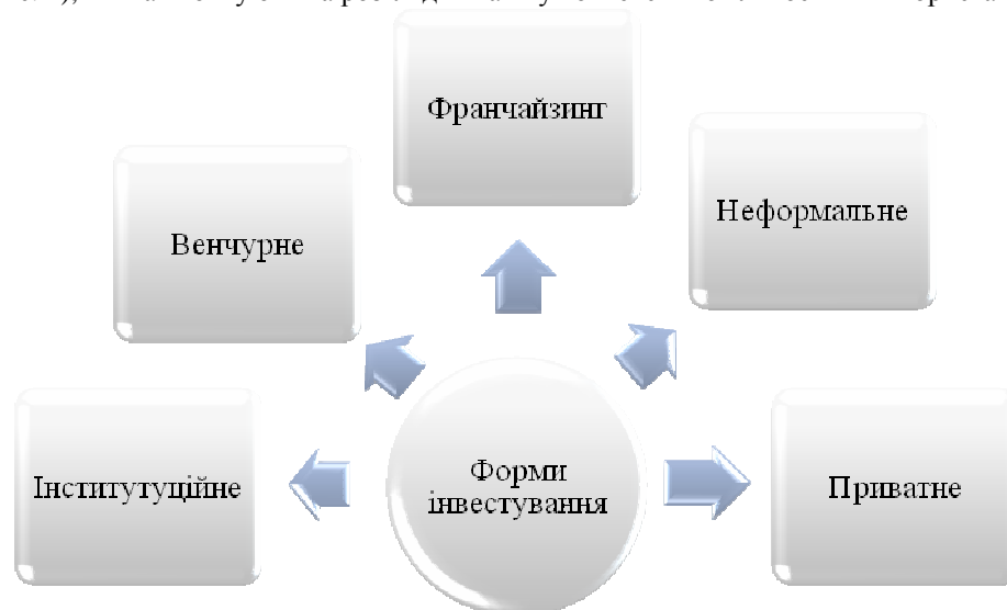
Рис. 1. Сучасні форми інвестування інноваційного підприємництва

Отже, поширеними формами інвестування інноваційних підприємств та підприємництва є: приватні інвестори, венчурні фонди, франчайзинг (рис. 1). Виникають ситуації, коли не завжди засновники або власники мають змогу вкладати кошти у подальший розвиток своєї справи та вимушені підшукувати тих, хто готовий проінвестувати їх інноваційні ідеї. Інколи інноваційна підприємницька ідея є високоризиковою й знайти інвестора важко. Саме тому, з плином часу, з'являються нові форми інвестування, зокрема неформального типу (зазначено на рис. 1), які нагтовхують на розгляд питань у контексті можливості їх використання в Україні.