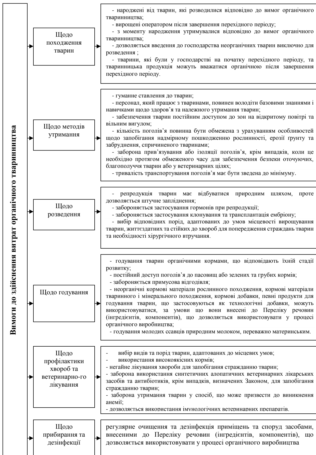
Рис. 3. Вимоги до виробництва продукції органічного тваринництва