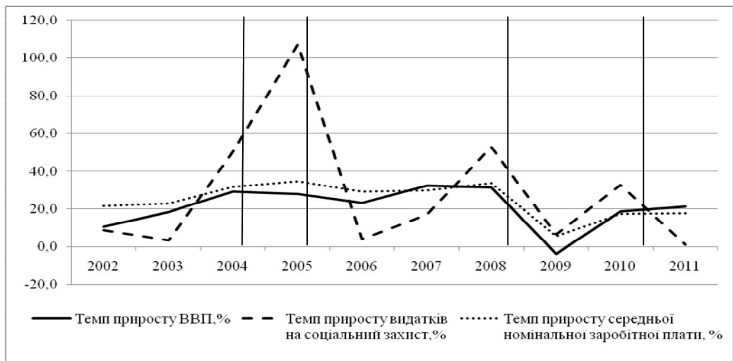
Рис. 3. Динаміка темпів приросту середньої заробітної плати, видатків на соціальну допомогу та ВВП