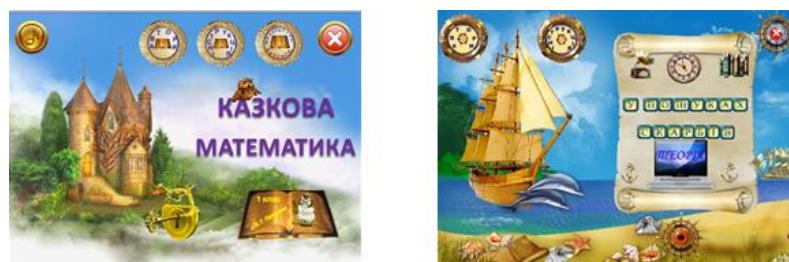
Рис. 3. Зображення титульних електронних сторінок електронних навчальних посібників.

На рис. 4 зображені титульні електронні сторінки електронного навчального посібника для 1 класу «Казкова математика» [2] та електронного навчального посібника для 2 класу «У пошуках скарбів» [3], виконаних в Adobe Flash CS 3.