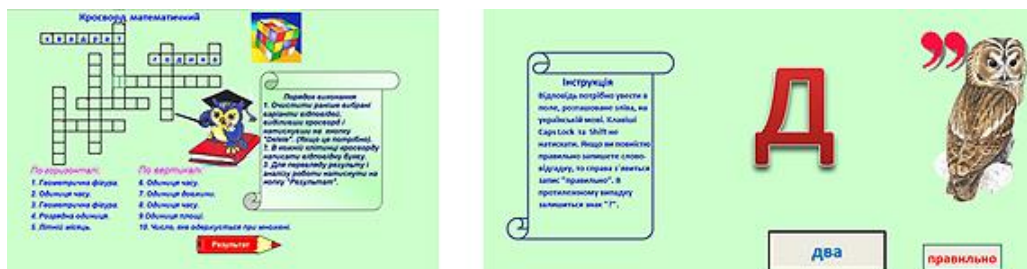
Рис. 2. Скриншоти ребуса та кросворда, виконаних в Microsoft Office Excel.

Дане середовище є привабливим для вчителів початкових класів, оскільки не потрібно застосовувати мову програмування Visual Basic for Application. У Microsoft Office Excel перехід між аркушами можна здійснювати за допомогою гіперпосилань. А щоб перевірити, чи правильно учень виконав завдання, слід використати вбудовані функції (рис. 2).