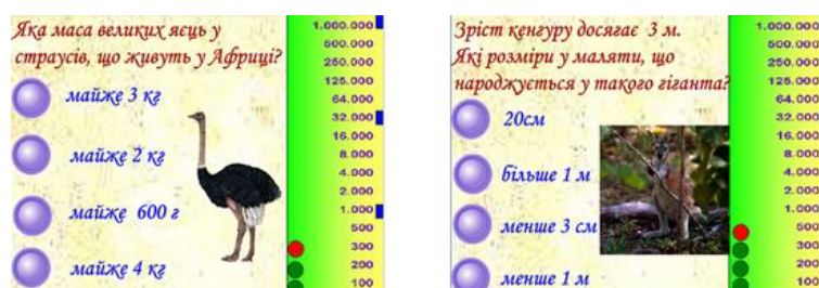
Рис. 1. Зображення фрагменту дидактичної гри «Математичний мільйон».

Вчителі майже на кожному уроці використовують ЕОР, створені самостійно, з використанням MS PowerPoint. В основному, це презентації, які вчителі початкових класів розробляють до більшості занять. Але нерідко вони створюють дидактичні ігрові програми з використанням Microsoft Office PowerPoint (рис. 1).