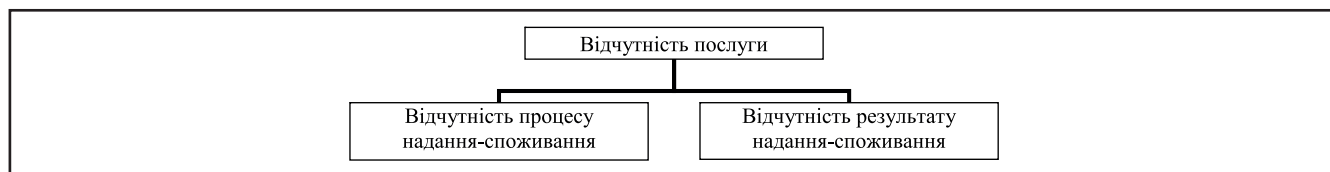
Рисунок 1. Складові відчутності послуг

Між осмисленою відчутністю процесу та відчутністю результату стоїть пунктирна стрілка. Вона означає, що в деяких сферах практично вся вигода від послуги полягає саме в процесі її отримання і не передбачає конкретного результату. Наприклад, ресторанна послуга: вигода тут, як правило, полягає в отриманні задоволення від вживання певних страв у певній атмосфері. Відчутність результату в даному випадку є осмисленою відчутністю процесу. Інша справа, коли йдеться про такі види послуг, які, окрім процесу, передбачають певний результат. Наприклад, освітні послуги. Тут процес надання не має сенсу без конкретного результату: отримання знань з певної