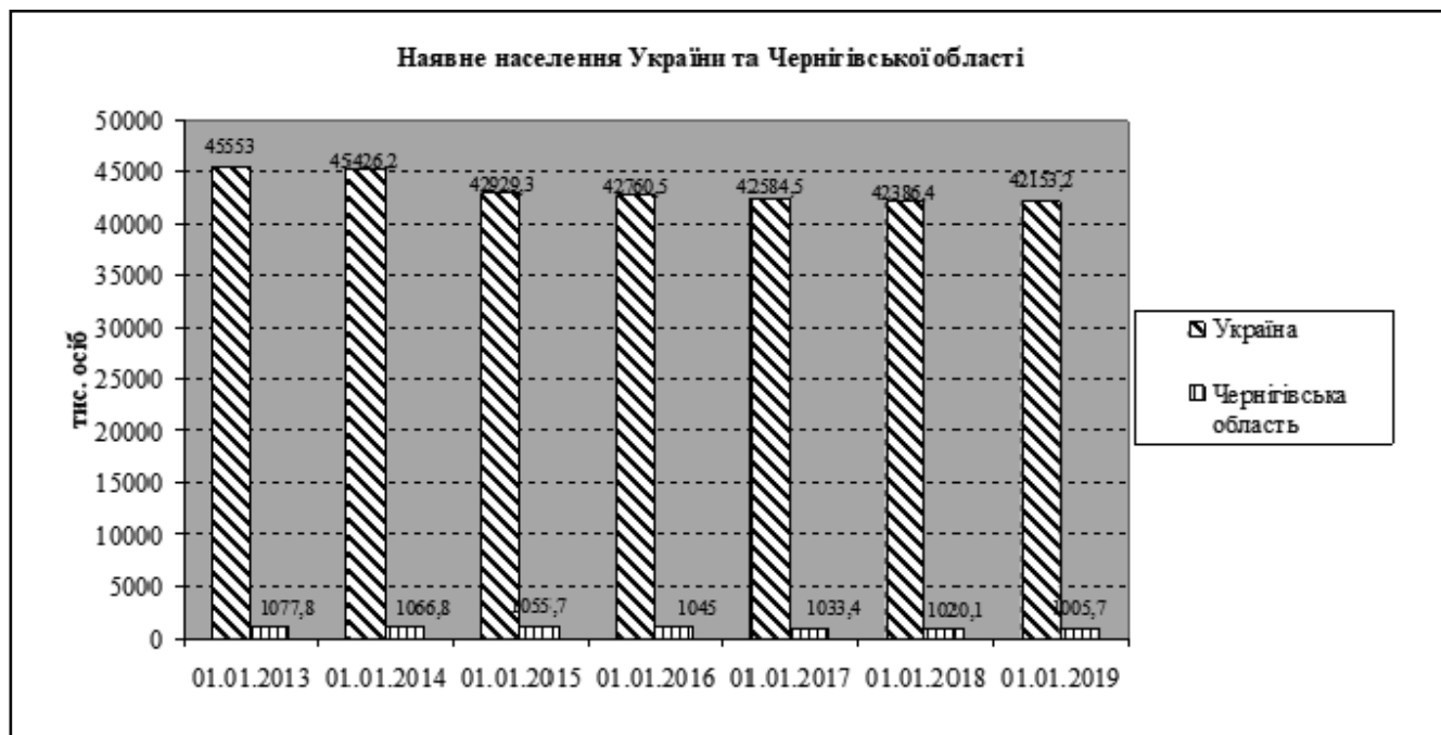
Рисunek 1. Зміна чисельності наявного населення в Україні та Чернігівській області, станом на 1 січня 2013–2019 рр.

Чернігівська область є однією з середньо урбанізованих областей України. Протягом 2013–2019 років рівень урбанізації зріс на 1,7 %, і досягнув 65,2 % (табл. 2). На початок 2013 року міське населення становило 684713 осіб, а