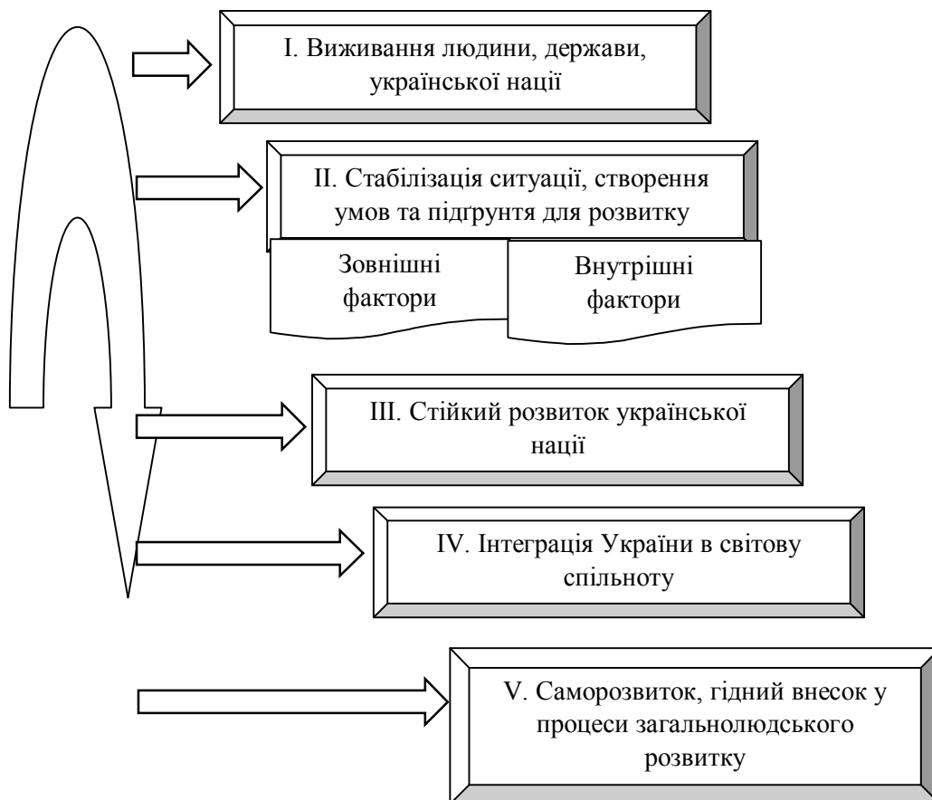
Рисунок 1. Структура національних пріоритетів України

Структура національних пріоритетів, що пропонується (рис.1), покликаний сприяти оптимізації створення та функціонування системи забезпечення реалізації національних пріоритетів. Він визначає, так би мовити, «об'єктивний коридор», у межах якого можуть бути плідно використані суб'єктивні підходи. Таке поєднання забезпечує необхідну обґрунтованість рішень з визначення загроз, створення та функціонування ефективної, збалансованої системи реалізації національних пріоритетів.