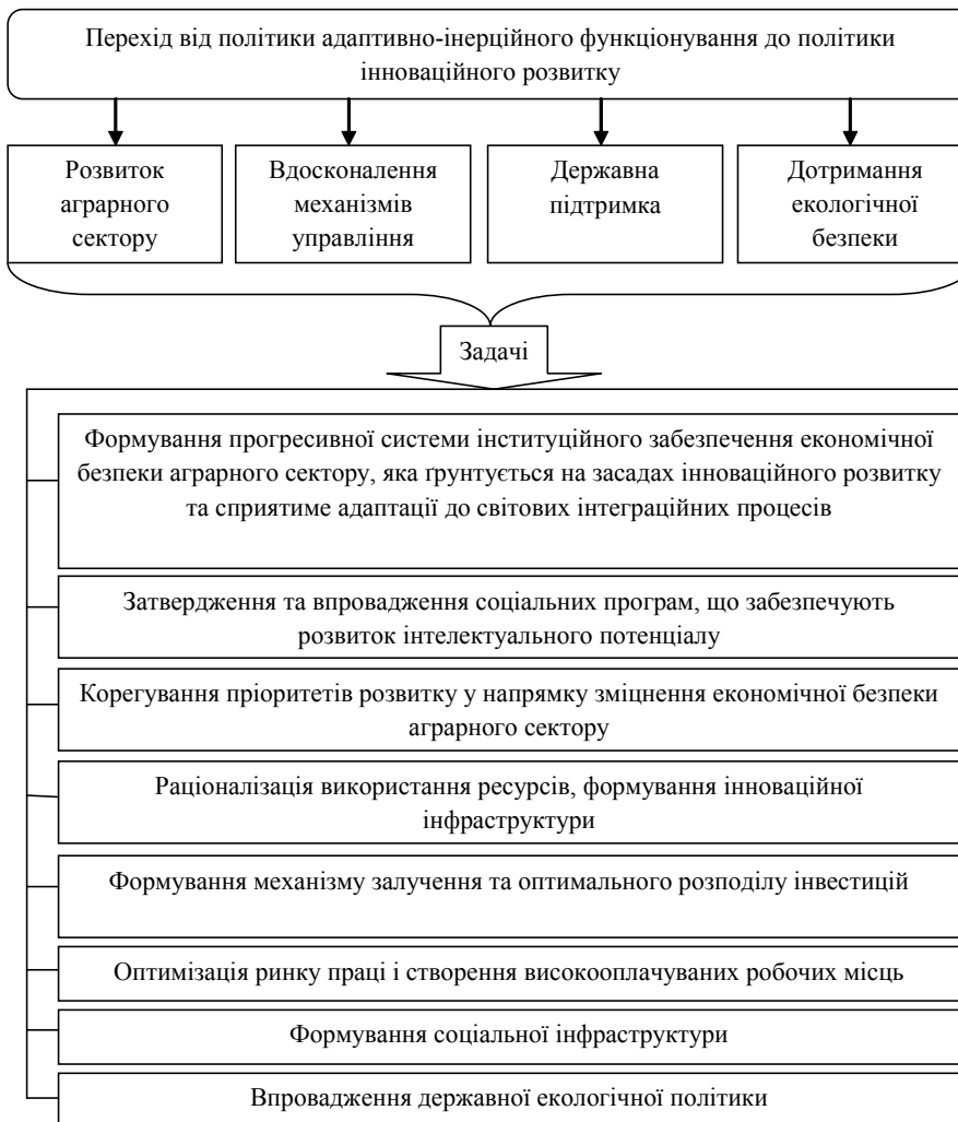
Рис. 3. Компаративний аналіз інституційних трансформацій в аграрному секторі