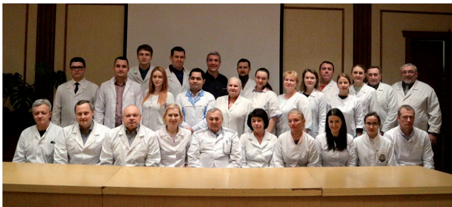
Рис. 8. Кафедра хірургічної стоматології та щелепно-лицевої хірургії.