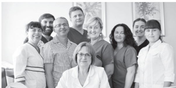
Рис. 12. Кафедра хірургічної стоматології та щелепно-лицевої хірургії дитячого віку.