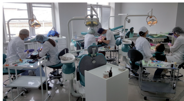
Рис. 6. Прийом пацієнтів студентами (2019 р.).

Вагомий внесок у розвиток професійної майстерності вносила Асоціація стоматологів