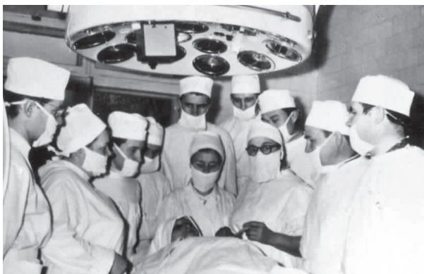
Рис. 4. Під час проведення операції (60-ті роки XX ст.).