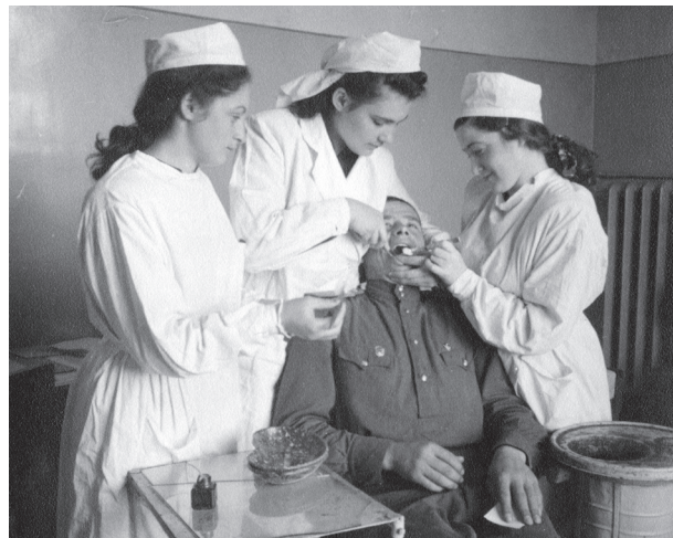
Рис. 2. Відпрацювання лікарських навичок. Прийом пацієнтів студентами Київського стоматологічного інституту (50-ті роки XX ст.).

У 1945 р. стоматологічний факультет вже вдруге був реорганізований у стоматологічний інститут. Поступово розширювалися його навчальні бази, формувалися наукові та педагогічні кадри. У 1947–1948 навчальному році в інституті навчалось близько 1000 студентів (рис. 2).