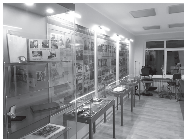
Рис. 17. Музейна експозиція у Стоматологічному медичному центрі.