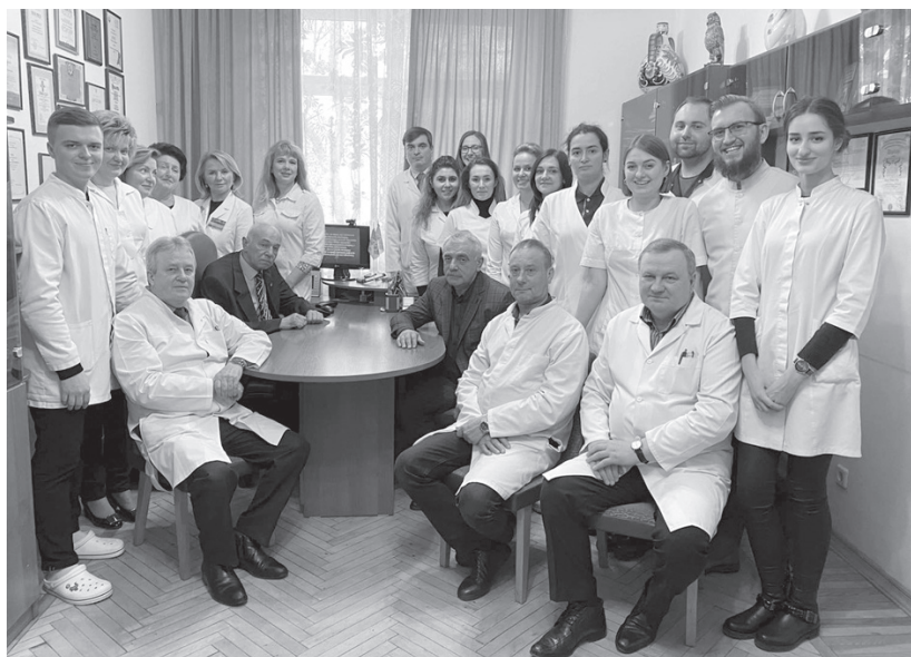
Рис. 11. Кафедра ортодонції та пропедевтики ортопедичної стоматології.