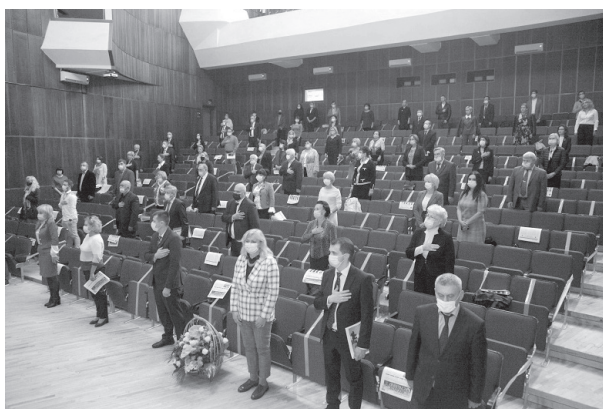
Рис. 13. Урочисті збори з нагоди 100-річчя стоматологічного факультету.

9 жовтня 2020 р. відбулися урочисті збори з нагоди 100-річчя стоматологічного факультету (рис. 13).