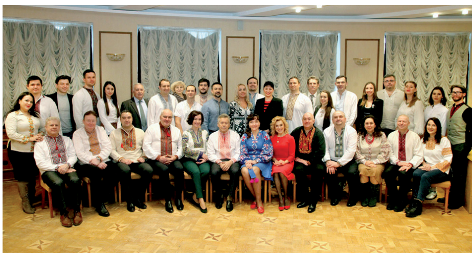
Рис. 9. Кафедра ортопедичної стоматології.