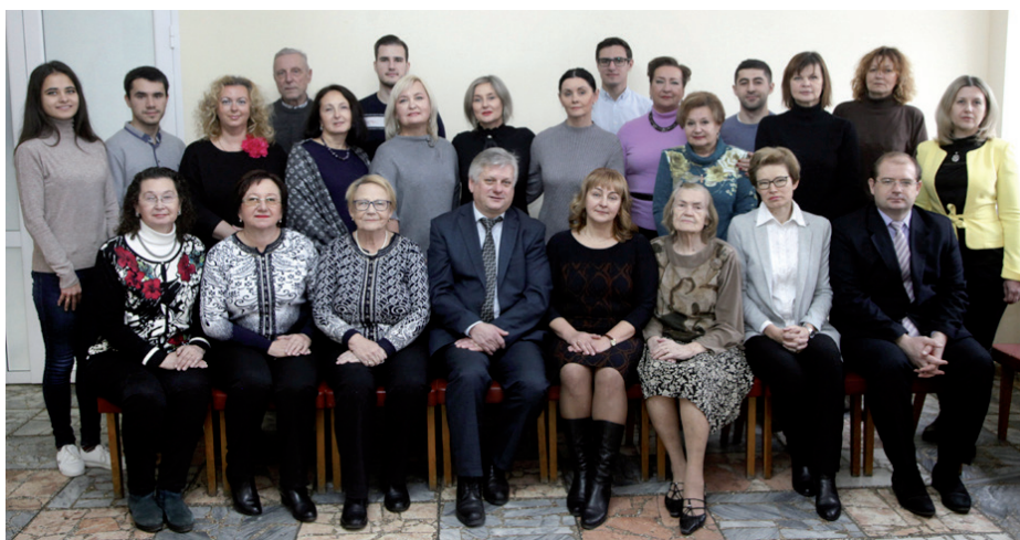
Рис. 10. Кафедра дитячої терапевтичної стоматології та профілактики стоматологічних захворювань.