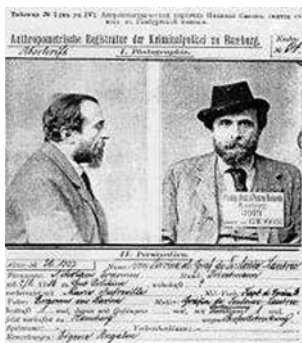
Антропометрична картка злочинця

пальця та мізинця лівої руки, довжина лівої ступні та лівого передпліччя.