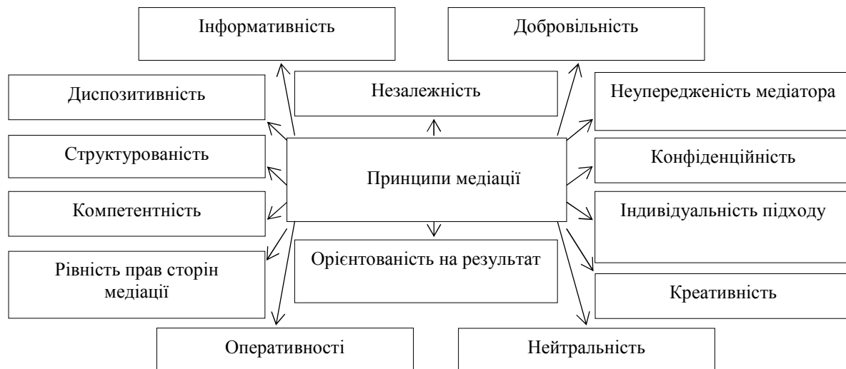
Рис. 1. Принципи медіації

проведення процедури медіації; за середовищем функціонування; за способом взаємодії процедури медіації зі судовим провадженням; за ступенем обов'язковості; за критерієм платності послуг медіатора; за суб'єктом, який ініціює процес медіації; за кількістю медіаторів; за технологією проведення медіації; за зв'язком медіатора зі сторонами контракту; за характером проведення; за сферами застосування.